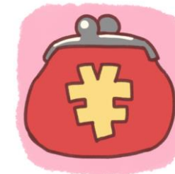
医療費や 経済的問題の相談