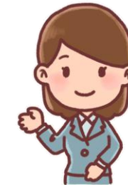
医療ソーシャルワーカー